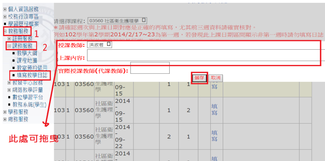
5. 圖：教學日誌列表及填寫按鈕畫面